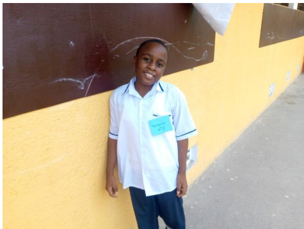
Zeugin eines Kandidaten