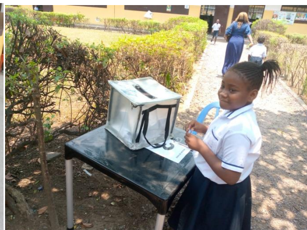
Wählerin an der Wahlurne

Die Amtseinführung und Vorstellung des gesamten Schulkomitees fand am Freitag, den 21. Oktober 2023, vor der gesamten Schulgemeinschaft statt und wurde von der Ballettgruppe "Sango Mbonda" musikalisch umrahmt.