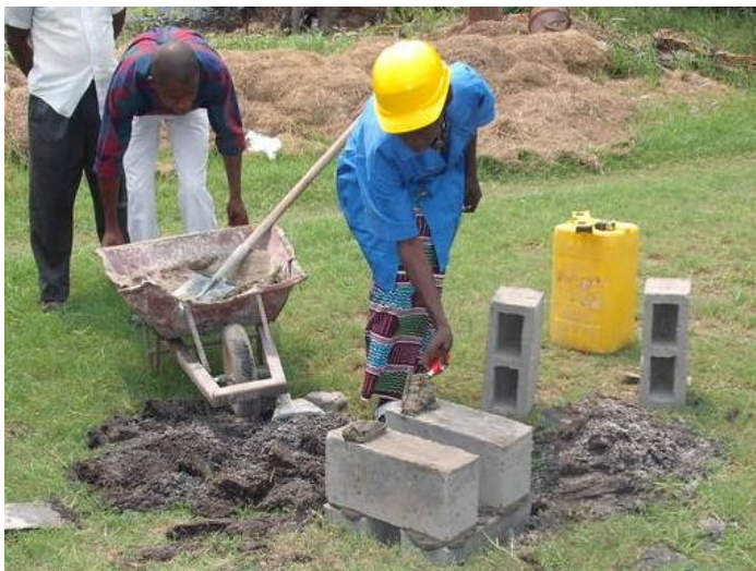
Grundsteinlegung für die neuen Toiletten

Am 19. Oktober fliege ich nach Kinshasa. Ich werde an der Mitgliederversammlung der ASSEAC, des Trägervereins der ACCADEMIA-Schule, und voraussichtlich an der Einweihung der neuen sanitären Anlage teilnehmen. Die nächsten Etappen der Sanierung, auch die Möglichkeiten einer Finanzierung durch kongolesische Ministerien, werden uns dann ebenfalls beschäftigen.