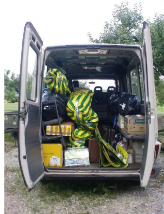
Kostbare Fracht im Bus, der im Container nach Kinshasa reist.

Ein großer Teil ist per Koffer in Kinshasa gelandet. Der Rest ist in einem Bus in einem Container auf dem Weg dahin (siehe Bild). Nun freuen sich die Schulen, den Kindern sinnvolle sportliche Betätigung bieten zu können.