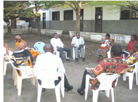
Die ASSEAC stellt ihr Projekt vor

Diesen Projektvorschlag tragen die deutsche HALLO KONGO gAG, gemeinnützige Aktiengesellschaft zum Erhalt der ACCADEMIA Schule, und die kongolesische Association Ecole ACCADEMIA, ASSEAC asbl, zusammen. Beide wurden im Herbst 2008 gegründet, die erste als Eigentümerin von Grundstück und Gebäuden der Schule, die zweite zur Aufsicht über den Schulbetrieb.